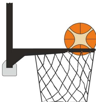
Obrázek 3 Míč v koši

31 - 20 Ustanovení. Jestliže se bránící hráč dotkne míče, který je v koši, je to přestupek.