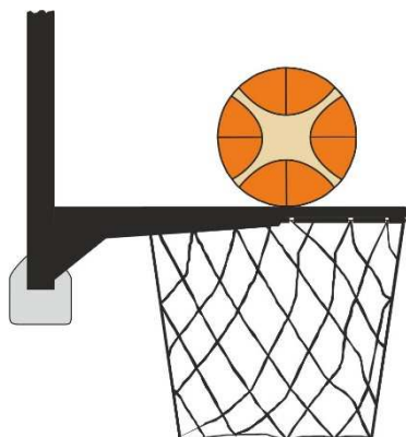
Obrázek 2 Míč v kontaktu s obroučkou

31 - 15 Ustanovení. Srážení míče nastává, když se během hodu na koš z pole obránce nebo útočník dotkne desky nebo koše, zatímco je míč v dotyku s obroučkou a má možnost padnout do koše.